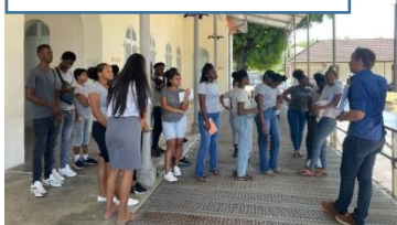
Visite de l'hôpital Jean Martial Le 27-09-22 avec la 1AGO2